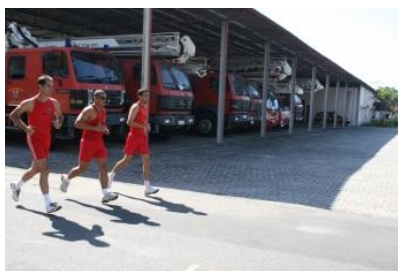
Execução do exercício

12.2.2. Flexão na barra fixa (masculino): será realizada sem contagem de tempo e sem auxílio de outro meio de elevação do corpo que não sejam os braços e com a pegada na barra em pronação (palmas das mãos voltadas para frente, dorsos das mãos voltados para o rosto). Cada repetição consistirá de dois tempos. O 1º será a flexão dos membros superiores até que o maxilar inferior ultrapasse a altura da barra e o 2º tempo será a extensão completa dos membros superiores. O número de repetições alcançadas pelo militar será convertido em pontos, conforme a tabela I.