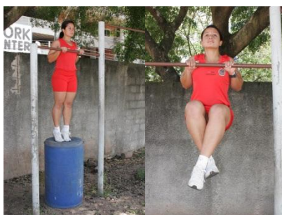
Posição inicial Execução do exercício

12.2.3. Barra estática (feminino): consiste na permanência em pegada de pronação (palmas das mãos voltadas para frente, dorsos das mãos voltados para o rosto), com o queixo ultrapassando a linha da barra, pelo maior tempo possível, em isometria, sem o auxílio de qualquer outro meio de sustentação que não sejam as mãos. A posição inicial será tomada com auxílio de meio de elevação. O tempo de permanência será convertido em pontos conforme tabela II.