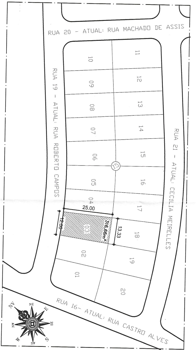
SITUAÇÃO ATUAL Esc: 1/1000