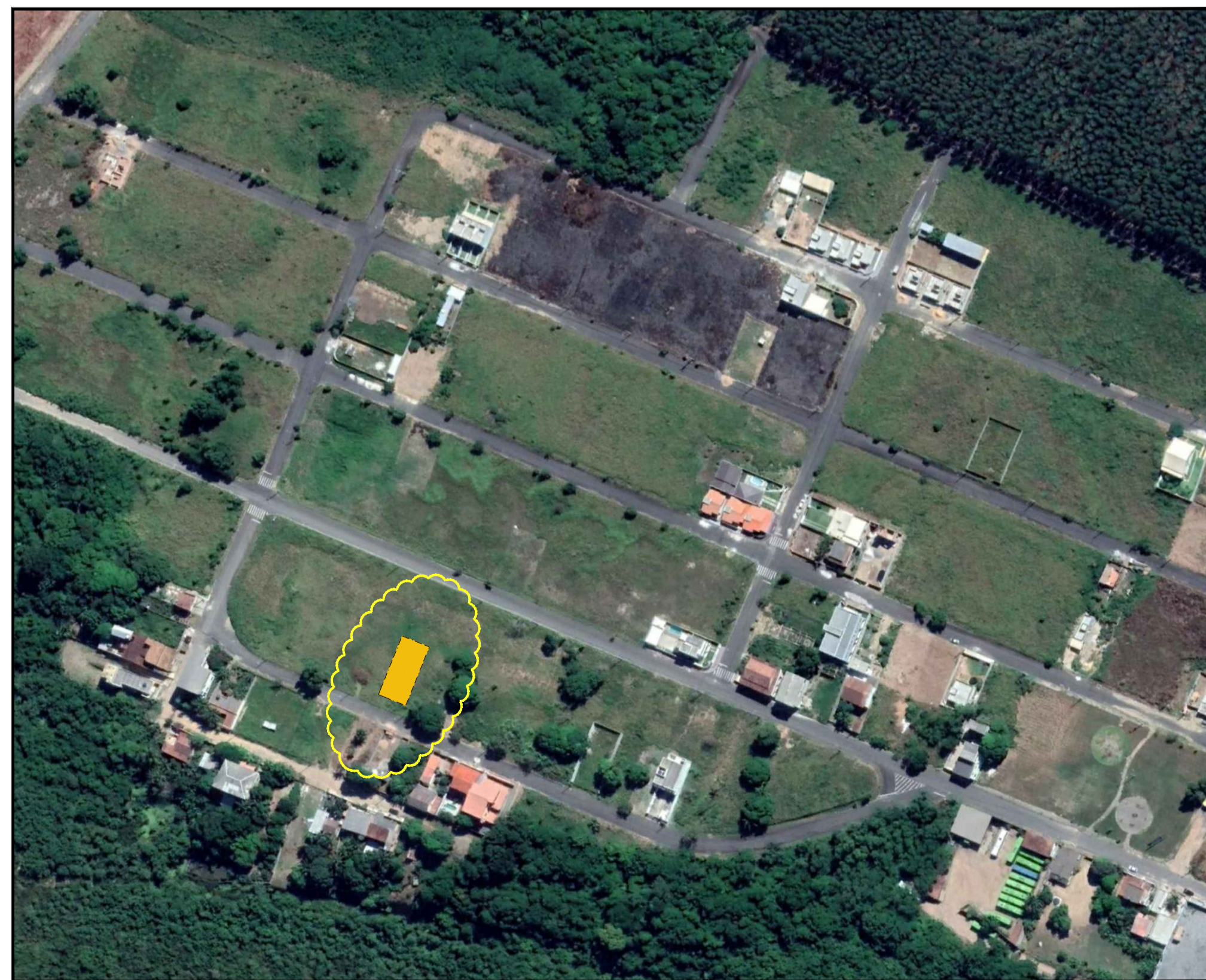
IMAGEM AÉREA DA ÁREA DE INTERVENÇÃO (Mapa Localização) ESCALA: 1:2000