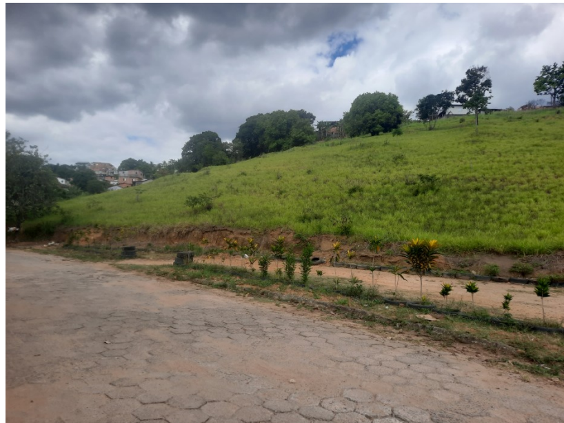
FOTO 01: Vista do terreno pela rua Francisco Barcelos Rangel