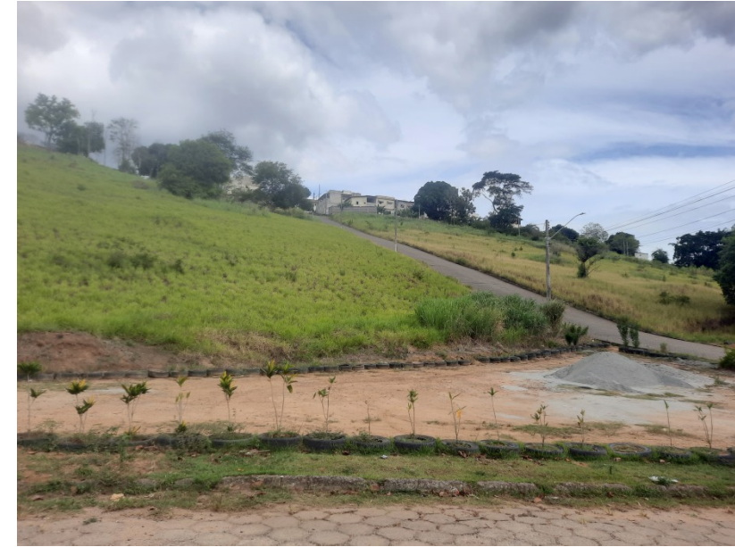
FOTO 03: Vista do terreno pela rua Francisco Barcelos Rangel