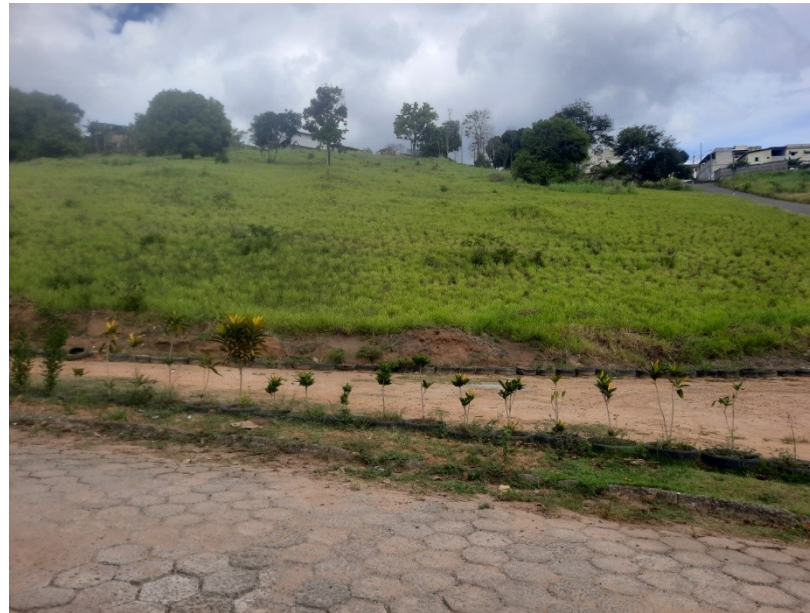
FOTO 02: Vista do terreno pela rua Francisco Barcelos Rangel