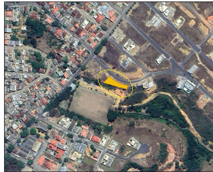
IMAGEM AÉREA DA ÁREA DE INTERVENÇÃO (Mapa Localização) ESCALA: 1:2000