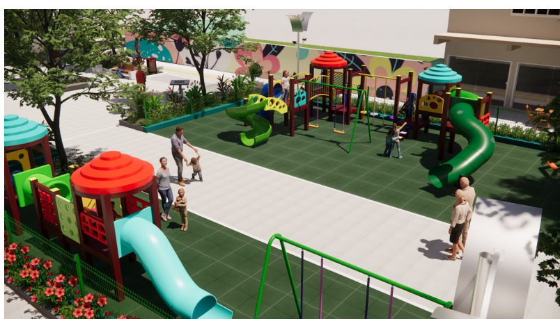
Vista aproximada da praça