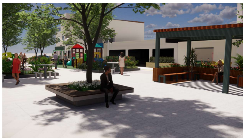
Vista aproximada da praça