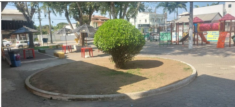
Imagem 02 – Praça existente

Não houve alteração da área da praça, permanecendo a praça com área pública e total construída de 1.267,05m 2 , conforme Quadro de Áreas abaixo: