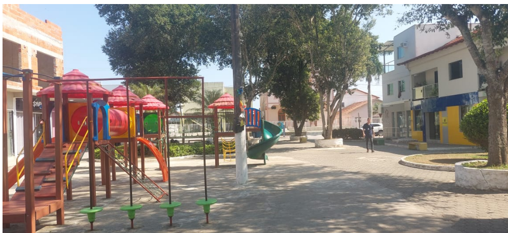
Imagem 01 – Praça existente

A praça existente, possui área pública total de 1.267,05m 2 , e consta de área pavimentada, algumas árvores, canteiros com plantas tipo arbustos, parquinhos, mobiliários (bancos em concreto armado) e ponto de ônibus.