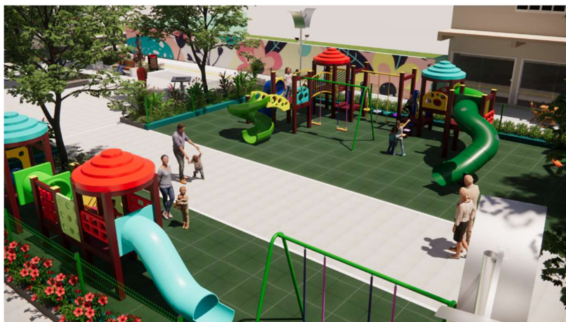
Vista aproximada da praça

Para garantir o cumprimento do cronograma da obra, a construtora deverá realizar o planejamento prévio das compras de materiais e contratação de serviços, de forma a assegurar que todos os insumos estejam disponíveis nos prazos adequados. A aquisição antecipada e programada é essencial para evitar interrupções nas etapas construtivas, contribuindo para a fluidez dos trabalhos e o não comprometimento do prazo final da obra.