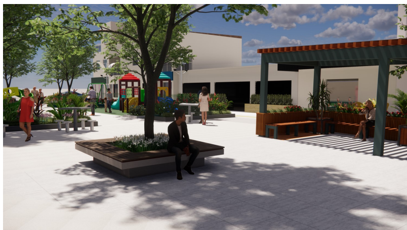
Vista aproximada da praça