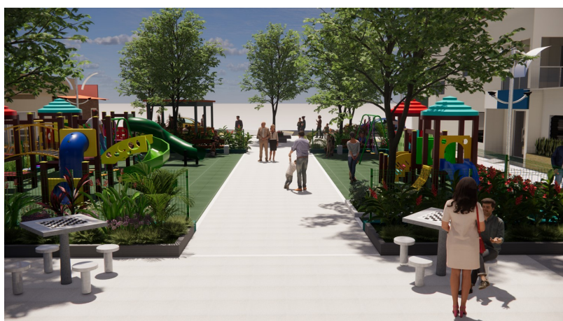
Vista aproximada da praça