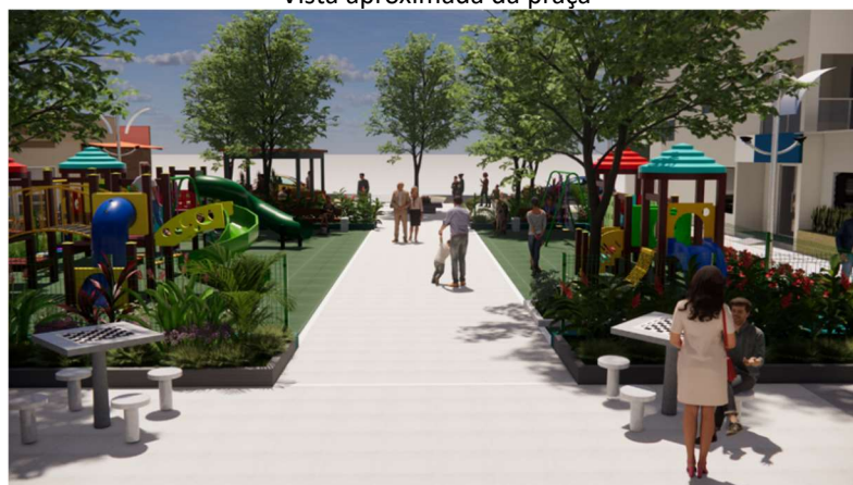
Vista aproximada da praça