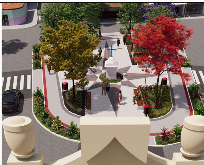
Imagem 3 – Vista aproximada da praça, após reforma