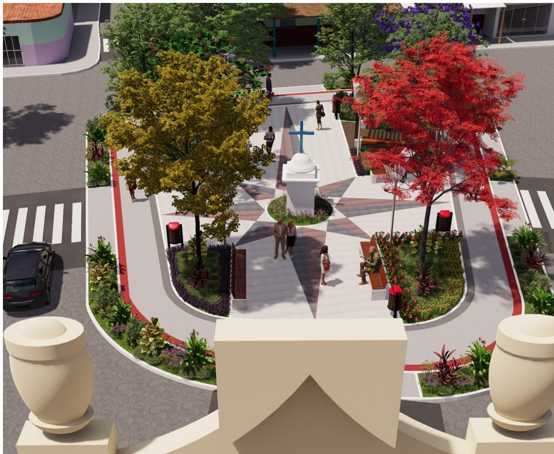
Imagem 3 – Vista aproximada da praça, após reforma