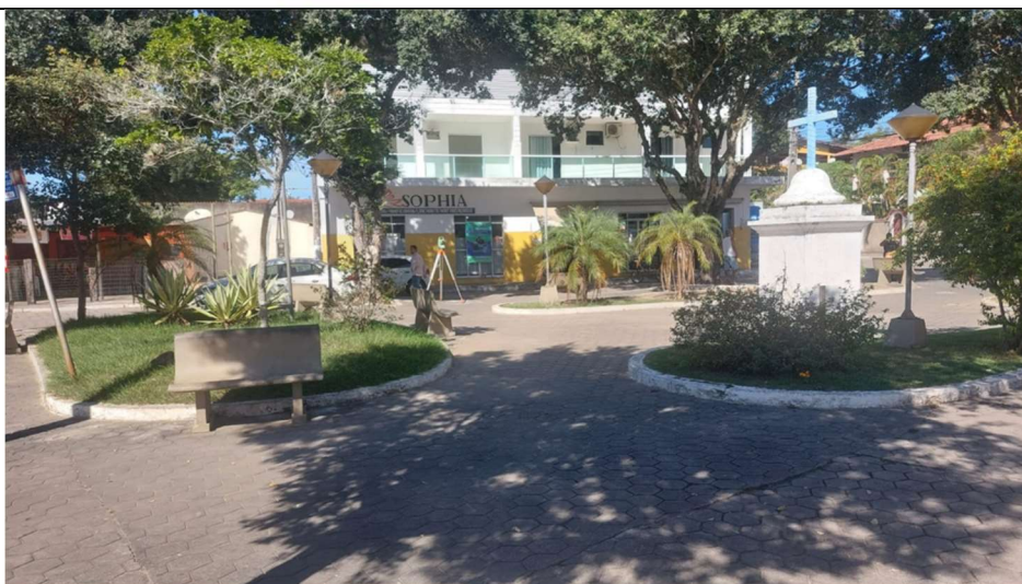
Imagem 1- Atual Praça Matriz

Após a incorporação da área da rua, de 92,04m 2 , a área total construída da praça passa a ser de 548,25m 2 , conforme Quadro de Áreas abaixo: