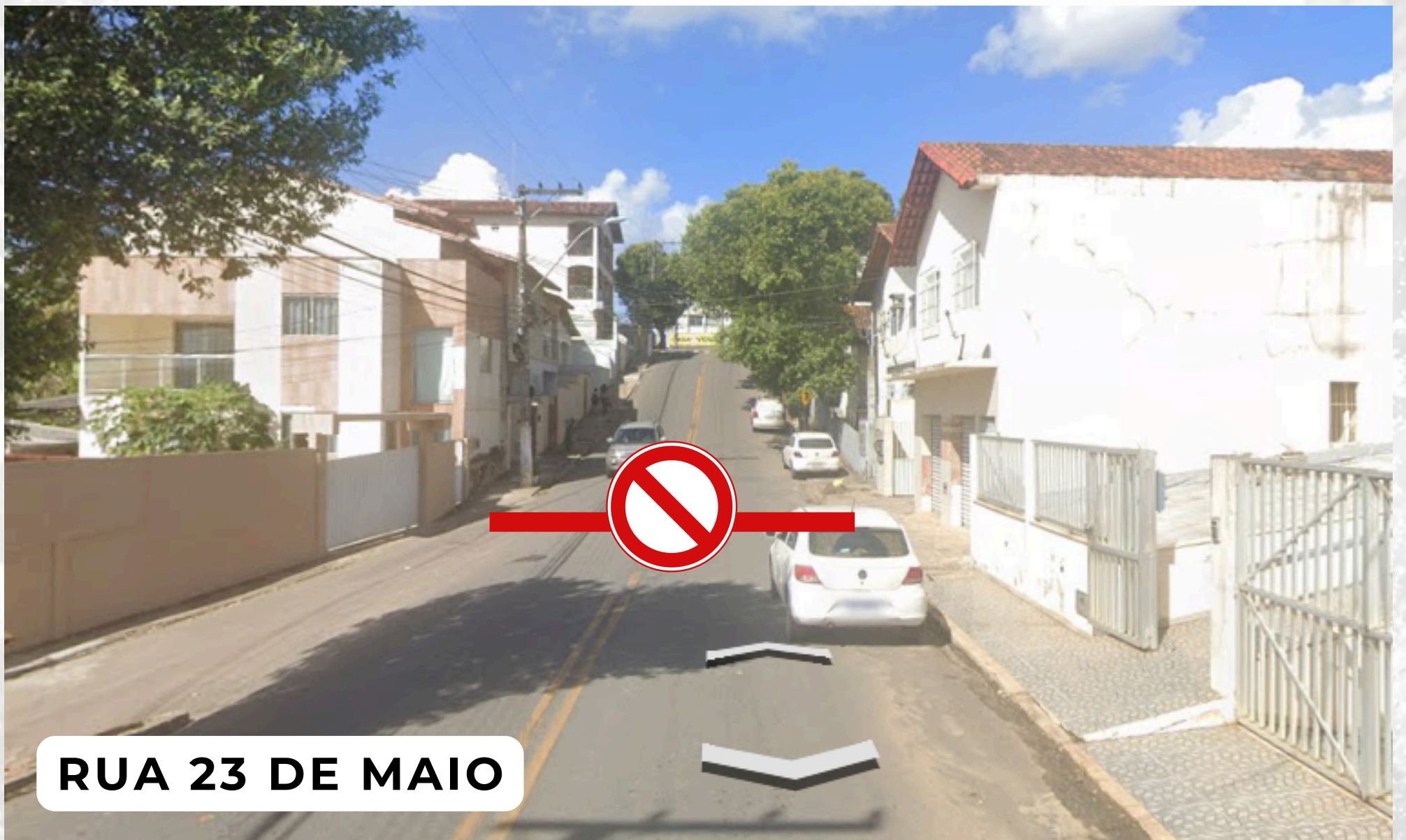
RUA 23 DE MAIO