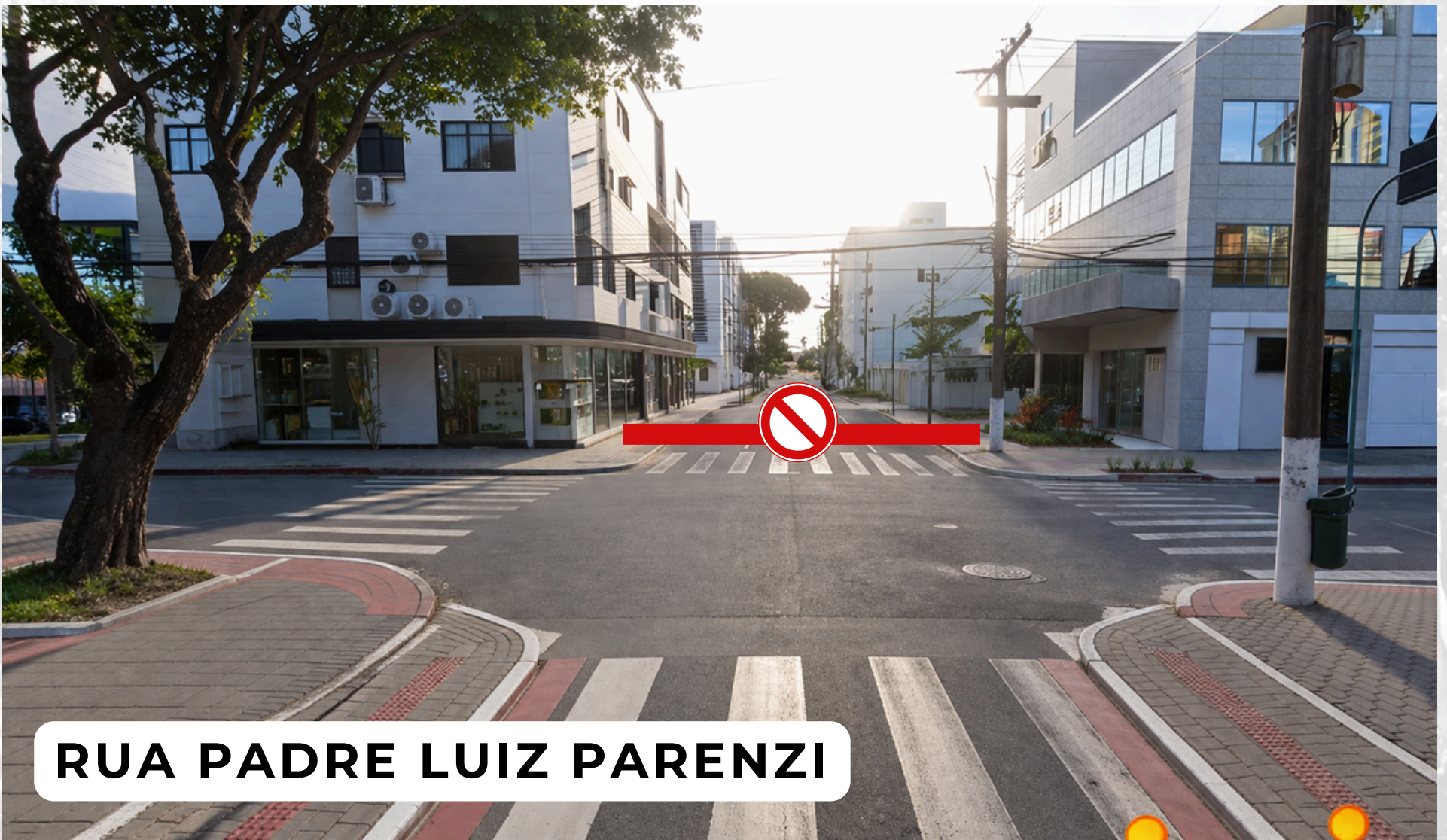
RUA PADRE LUIZ PARENZI

Secretaria Municipal de Mobilidade Urbana SEMURB