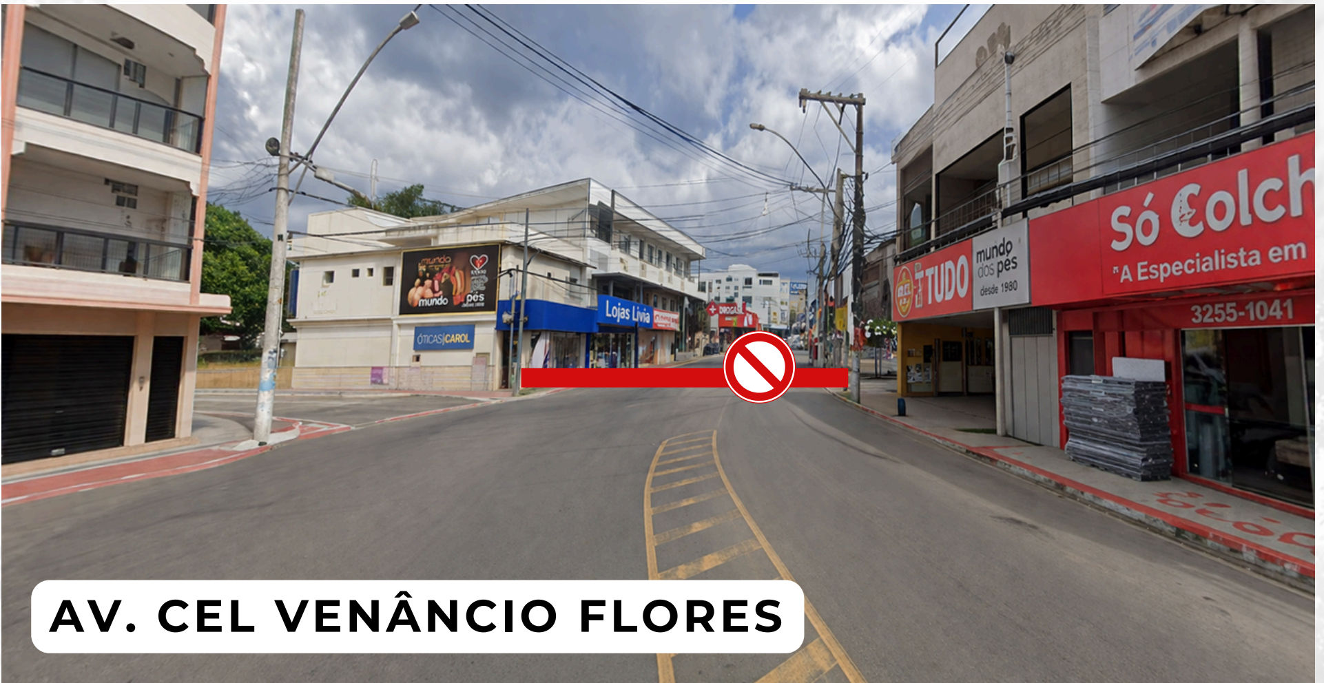
AV. CEL VENÂNCIO FLORES