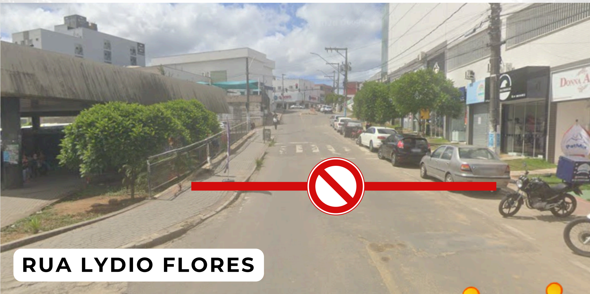
RUA LYDIO FLORES