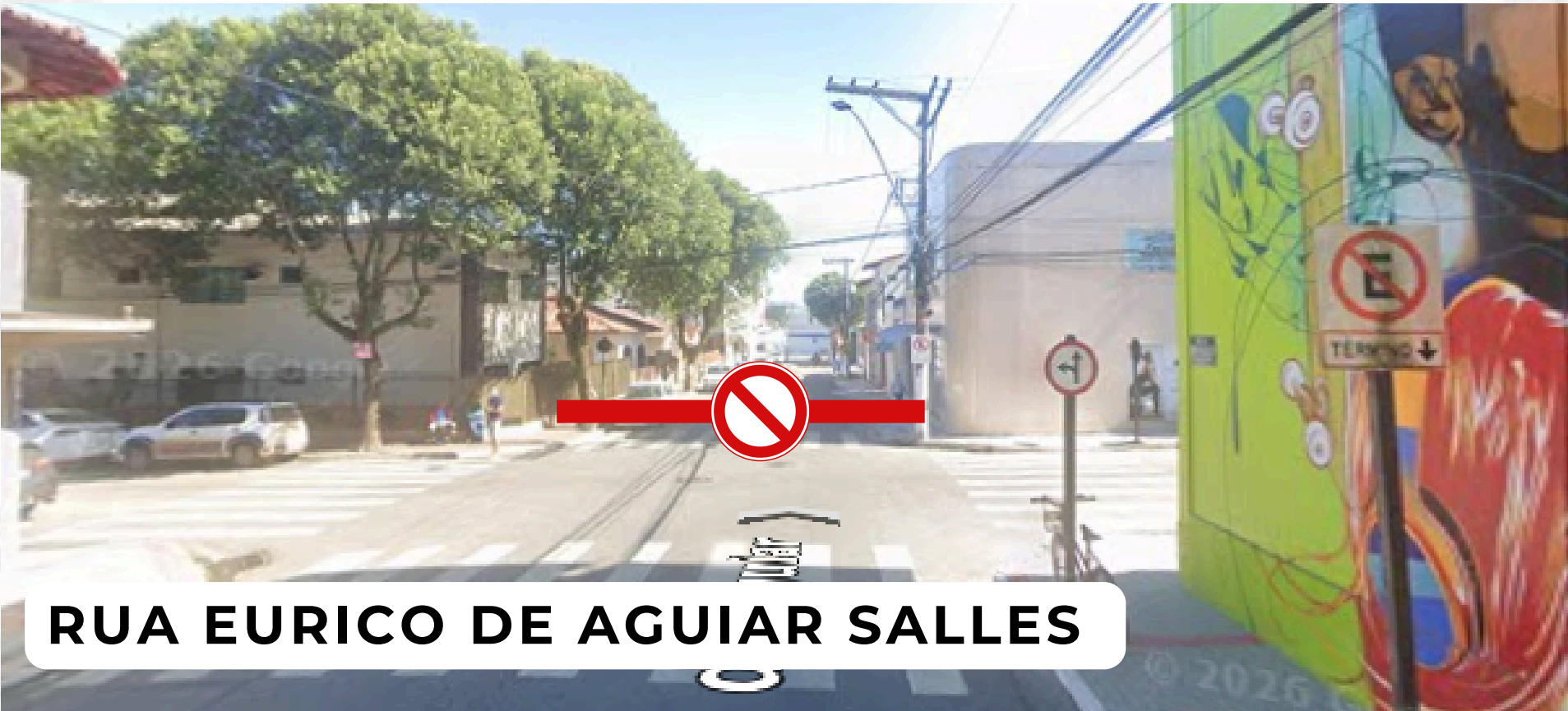
RUA EURICO DE AGUIAR SALLES