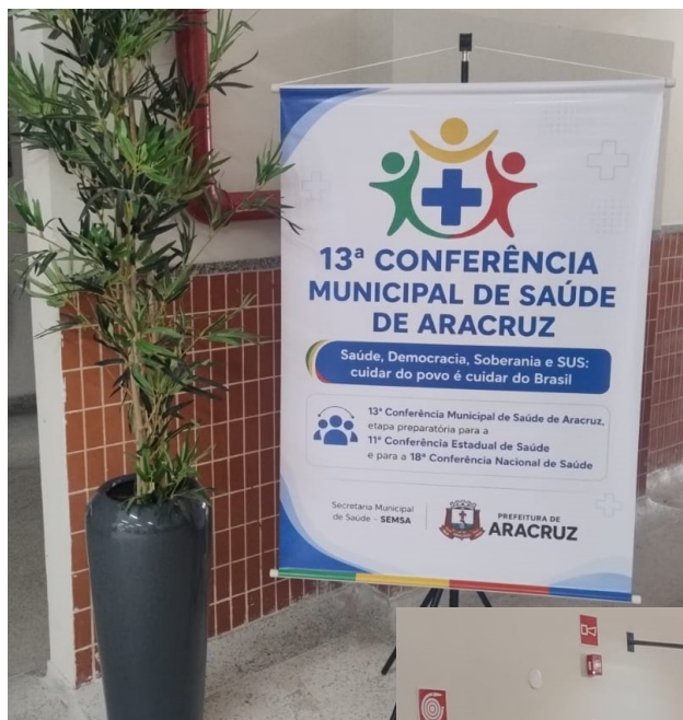
Recepção e Inscrição